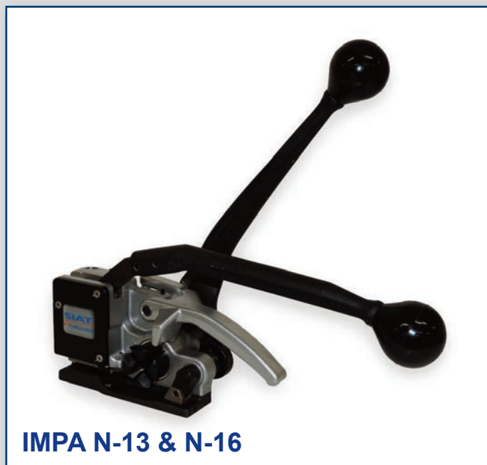
IMPA N-13 & N-16