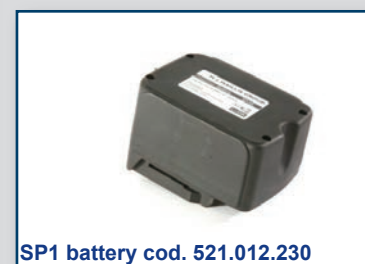
SP1 battery cod. 521.012.230