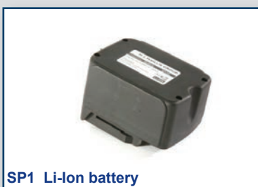
SP1 Li-ion battery