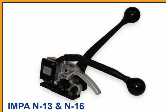
IMPA N-13 & N-16