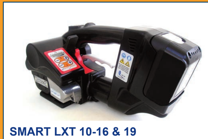
SMART LXT 10-16 & 19